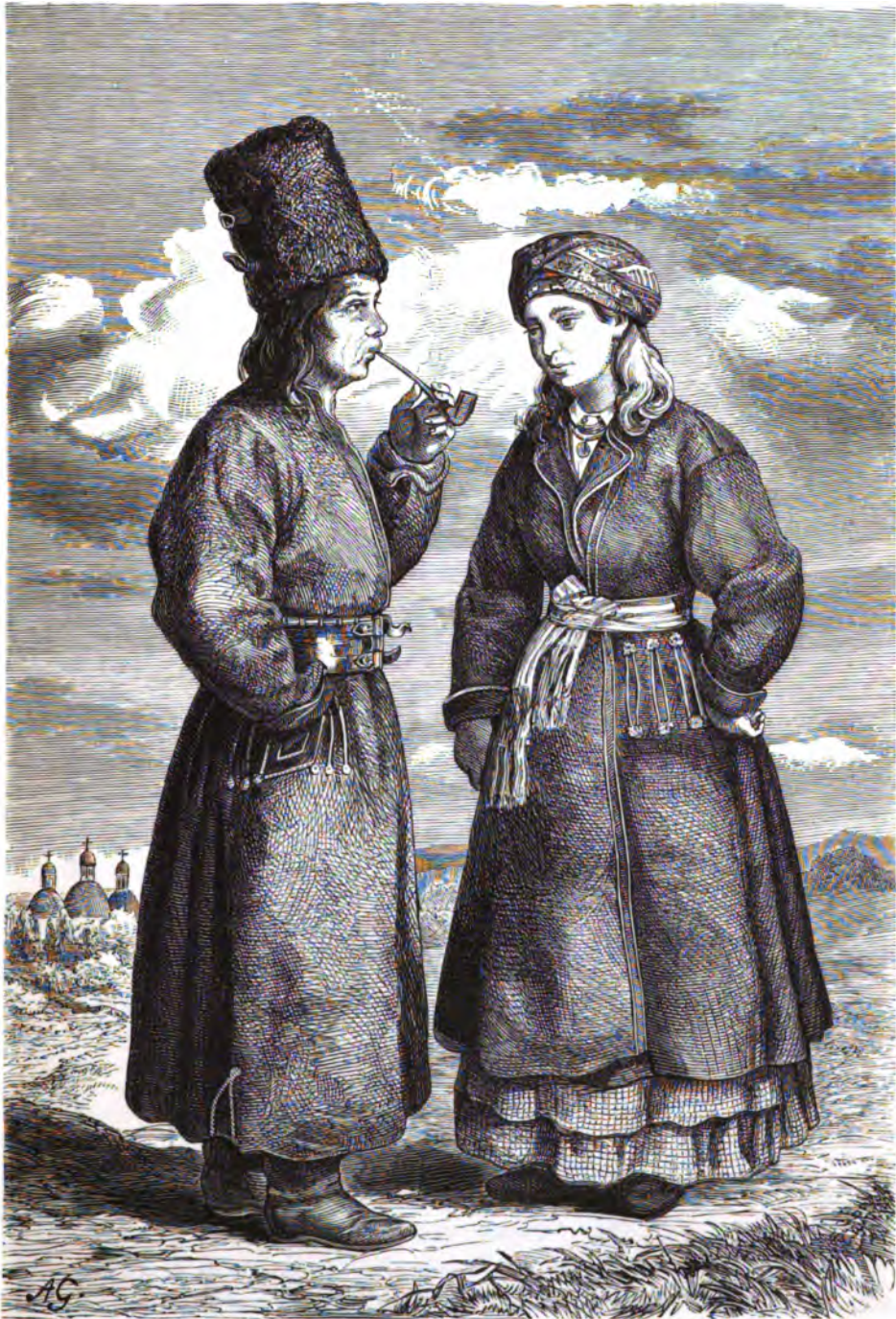
Русскіе крестьяне Золочевского уѣзда села Стрептова въ восточной Галичинѣ.