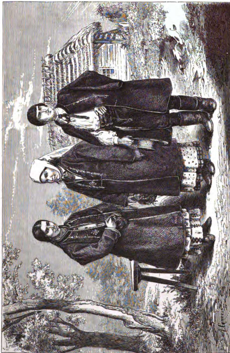
Рускіе крестьяне Станиславскаго уѣзда села Нагорянки въ восточной Галичинѣ.