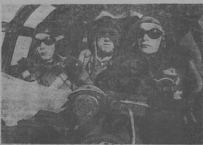
Отдвечен лавальчик вь бомбардировочный лётку.

На основ повсюдомения корреспондента МТИ вь Париж правительственный председатель Лаваль вь передаче председателю промышленности коморь поддержал информативную беседу, вь которой немцы промисказал, что никто не знает ни здійснителсь доклад выказа союзников, но то факт, что ивничей армия не можно победить. Нёмцы розпоряжают зь великими резервами. Лаваль напоминив французам, чтобы варовались от всяких неудобностей, понеже поступания ивничей есть дуже строгое и вь случае найважшего переступка кары будутъ незыскатели. Нёмцы не признають и найважшое нарушение общественного порядка.