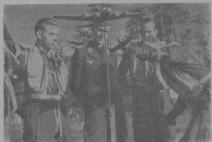
Подготовка новыхъ пилотовъ.

Ханецъ: Что крикнѣ! Не бойтеса, се я зѣмъ го.