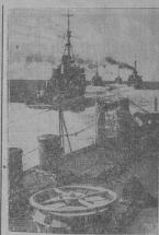
Крѣпости на море