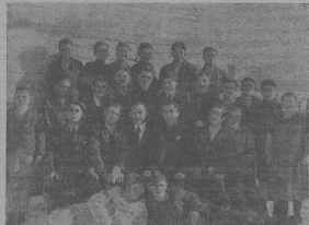
Участники первого сегоднѣшняго курсу на Вощей Шолом Народного Образованя.

Эъ Буапулестъ голосеть (МТ): Егъ Исидеиноволостъ Ренетъ Угровщины выименованъ Монарй Дирхала великоземельца — члена Верхня Палаты державнымъ секретарёмъ при министерствѣ земледѣлствя, а Дръ балашкый Кипъ Вадря подкуница Кеметова державнымъ секретарёмъ при министерствѣ народнаго аэомострѣн.