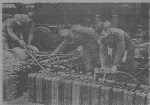
Приготовлены на нападѣ

На восточной части сего фронта, де военну чинность продолжаетъ 8-ма английскѣ армѣя пануе относительно тишина, что и сѣтъ доказано тѣмъ, что осередкомъ боѣвъ хотѣтъ зрѣбѣти западну часть сего фронта.