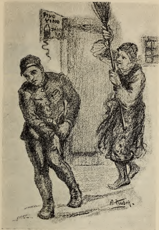
Schvatila židovu mítlu a vyčesala s nju Petra