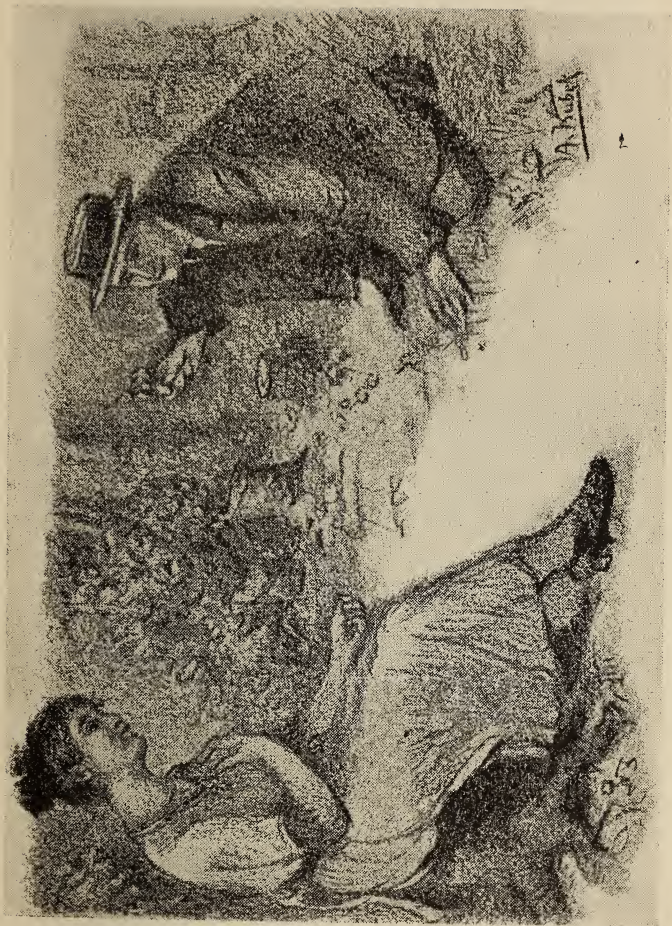
Oboje v čistom byli uže so soboju. ----Str. 135.