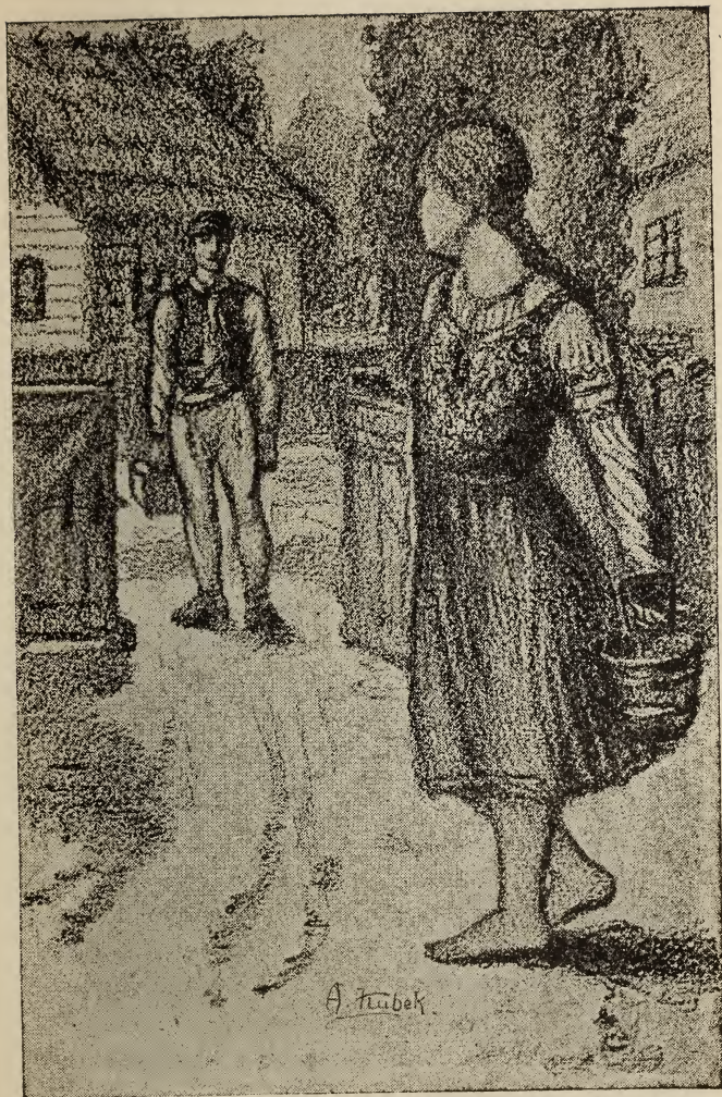
Dívuška ljubopytno prizeralasja na neho_____ Str. 43.