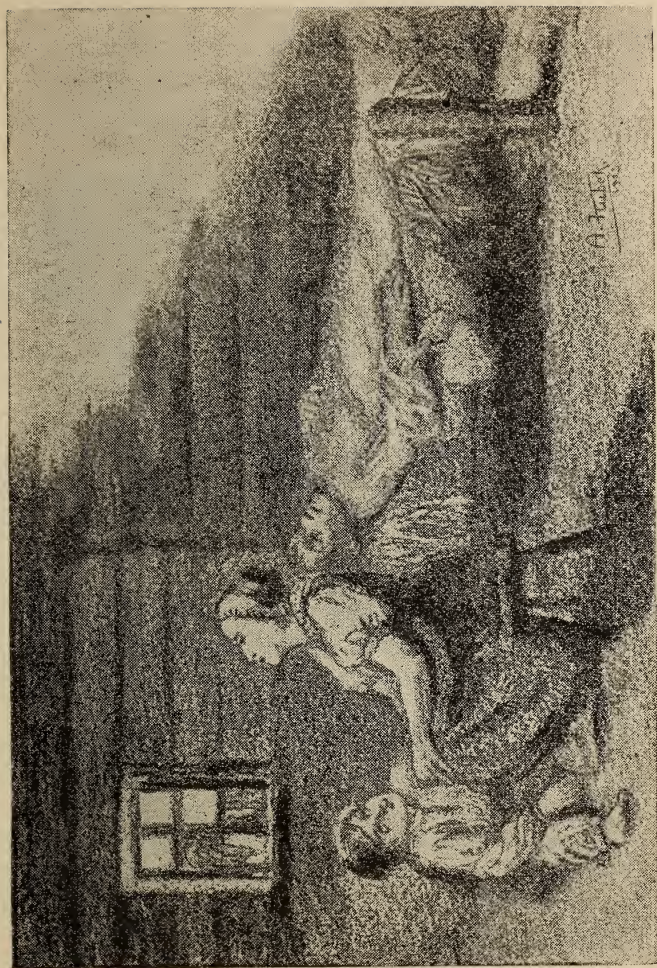
Hanja pristolno vyzerala oknom--- Str. 12